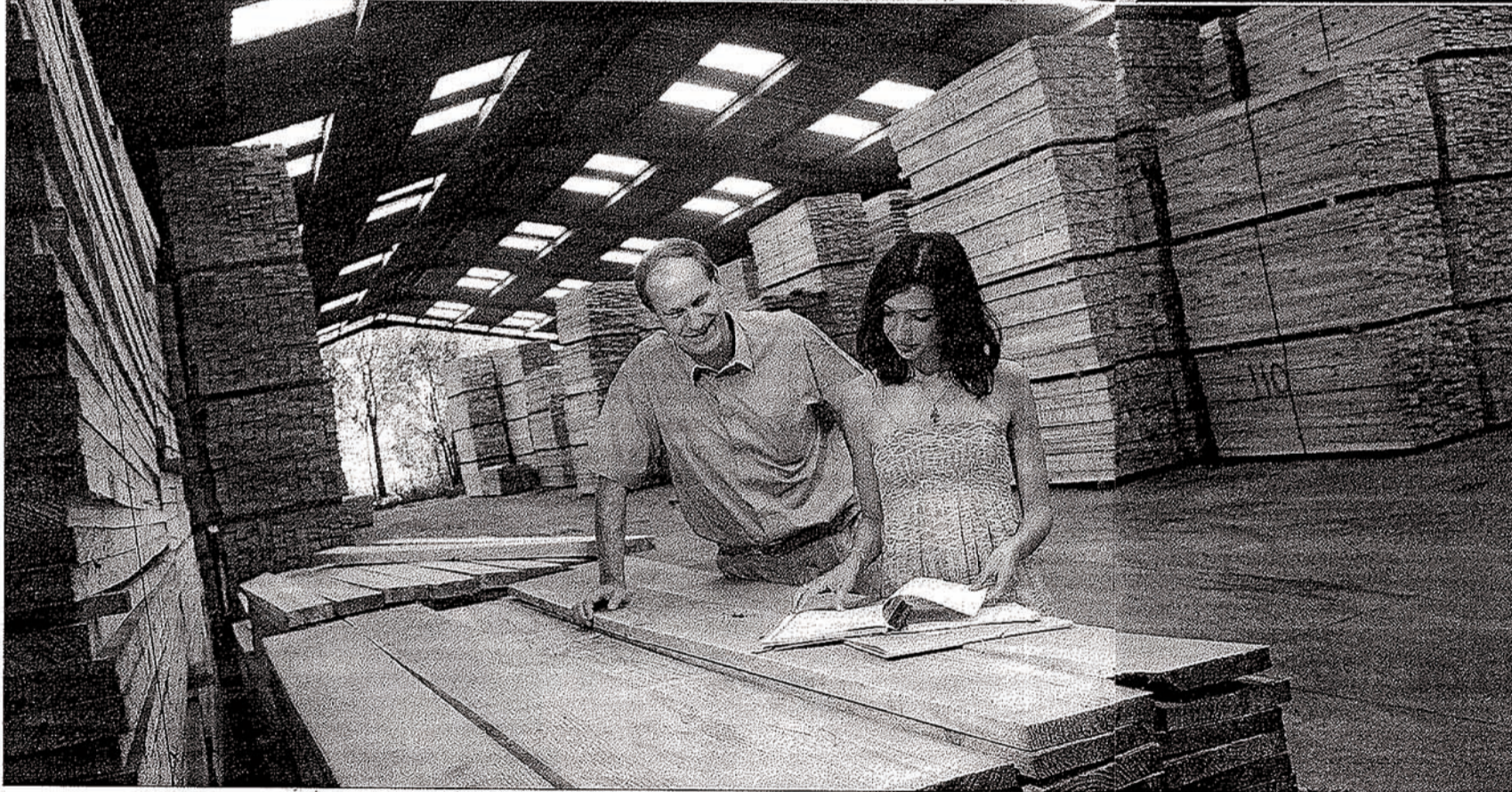
Du livre numérique à Pessac aux caisses en bois à Saint-Médard, les étudiantes en histoire découvrent un